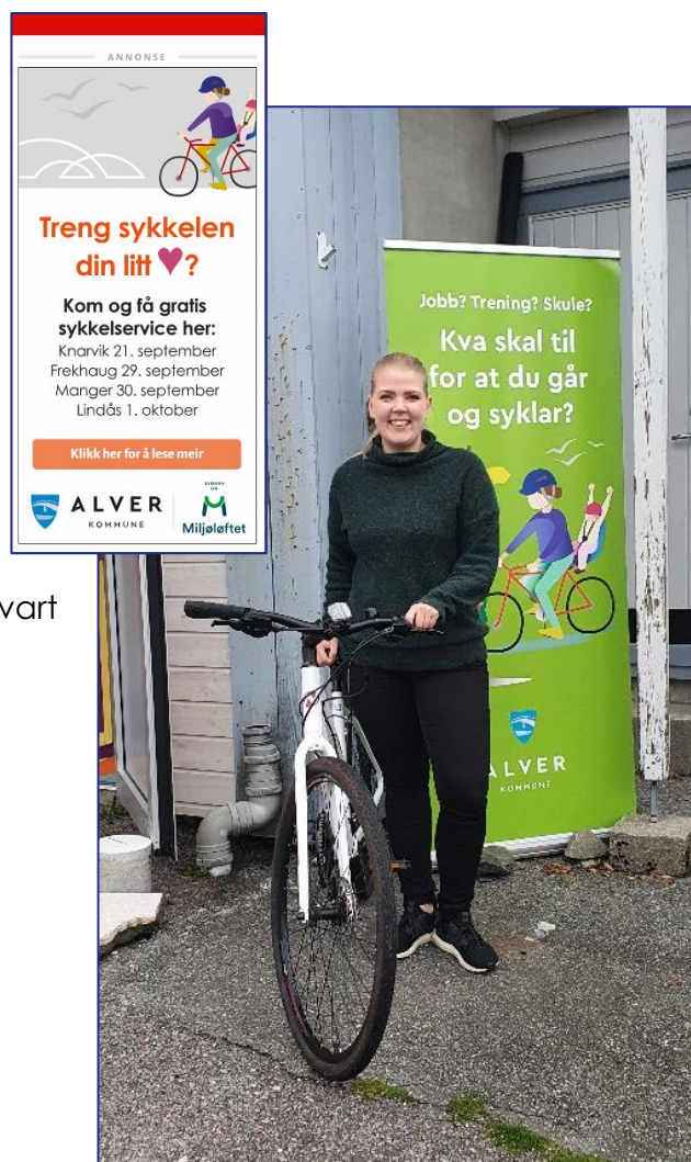
Figur 1 Ordføraren vitja sykkelservicen på Manger

Gratis sykkelservice blei arrangert i Knarvik, Frekhaug, Manger og Lindås. Heile 80 syklistar fekk gratis service på sykkelen, i tillegg fekk kommunen innspel til spørjeundersøkinga om framtida til Alver som også var relevant for sykkel. Sykkelservicen i Knarvik vart arrangert av Miljøløftet, men kommunen var representert for å opplyse om sykkelstrategiarbeidet til kommunen og oppmoda folk om å svare på dei digitale innspelskanalane. På Frekhaug og Manger var også BUA open. Sykkelservicane vart annonsert i lokalavisa og lokalavisa laga sak på hendinga.